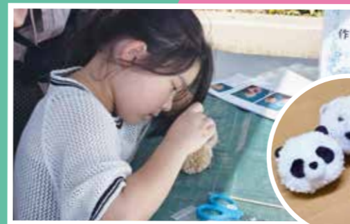
キーホルダー作成中！ かわいくつくれたかな？

イベントの日程に関しては、ぜひさがみはら市民朝市のHPをチェックしてみてください。