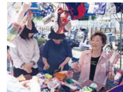
会話を楽しみながら お気に入りの作品を 見つけられたようです。