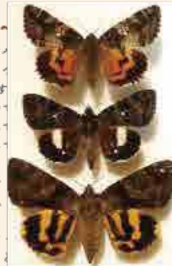
▲上からオニベニシタバ、コシロシタバ、キシタバ

現在でも、市内の「東林ふれあいの森」や「ともれびの森」で見ることができます。特にクスギの樹皮や樹液の周りに多く生息しています。5月下旬にはアサマキシタバ、6月上旬～フスキキシタバ、中旬～オニベニシタバ、7月～はコシロシタバ、キシタバ・マメキシタバが見られることでしょう。8月も見ることがありますが、早い時期の方が綺麗な個体をより多く見られます。