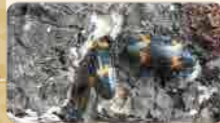
▲ キノコムシの仲間

倒木にはカミキリムシ類、ヒラタケなどのキノコにはキノコムシ類やゴミムシダマシの仲間を観察することができます。