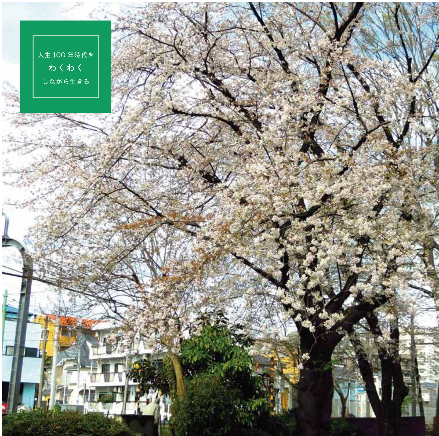
▲ 林間公園の桜の様子